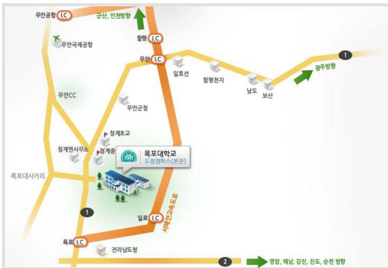
【木浦大学道林校区简图】